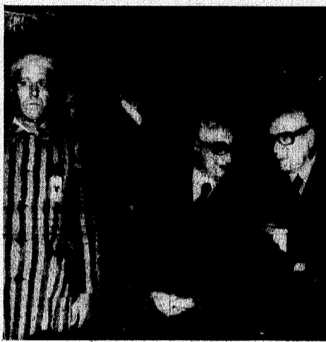
Il presidente della Repubblica, Leone, e il presidente del Consiglio, Rumor, hanno partecipato alla commossa manifestazione che si è svolta domenica a Terranova di Padova per onorare il sacrificio degli italiani internati nei campi nazisti. (SERVIZIO A PAGINA 2)