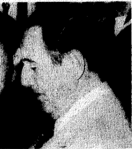
SERVIZIO A PAGINA 10

Nai discorsi che il presidente della Banca mondiale per la ricostruzione e lo sviluppo, McNamara, e il direttore generale del Fondo monetario internazionale, Witteven, hanno tenuto ieri a Nairobi apprendono i lavori della conferenza annuale monetaria, i paesi industrializzati sono stati richiamati al dovere di sostenere con maggiore impegno lo sviluppo dei paesi emergenti. La riforma monetaria, ha detto Witteven, dovrà essere tale da agevolare gli scambi commerciali del Terzo mondo.